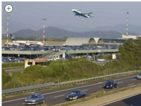
Un aereo in decollo dall'aeroporto di Orio