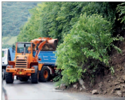
Mezzi in azione a Zogno, sulla provinciale 470, per rimuovere i detriti caduti sulla strada

BERGAMO - Frane, smottamenti, allagamenti e fiumi in piena. La Bergamasca da tre giorni è sotto l'acqua e si cominciano a contare i danni. Intorno alle 12.30 di ieri si è verificata una frana sulla strada provinciale 470 per la Valle Brembana. A Zogno, in località Tre Fontane, all'altezza del distributore di benzina della Esso, il muro di contenimento a monte ha ceduto e circa 30 metri cubi di terra, piante e sassi si sono riversati sulla carreggiata. La strada è stata chiusa per circa un'ora e l'intera valle è rimasta isolata. Il tempestivo intervento della protezione civile, dei vigili del fuoco e della polizia locale ha permesso di riaprire la strada, con un senso unico alternato, intorno alle 13.30. Disagi per la circolazione si sono verificati su tutto il territorio: la galleria Pradella si è allagata e ci sono stati smottamenti a Palazzo, sul Monte Canto e in località Riviera.