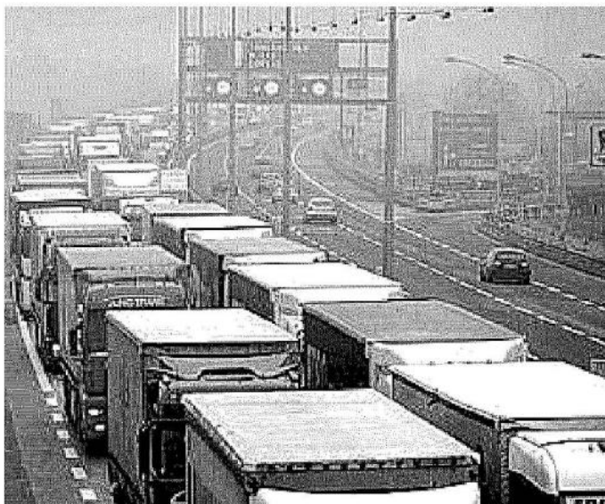
Oggi e domani al Plenipotenziariato il vertice europeo

L'Assemblea Generale di Mantova si svolge a seguito di precedenti incontri svoltisi a Stoccarda (Germania), Turku (Finlandia), Napoli (Italia) e Malmö (Svezia) e può contare sulla partecipazione di membri provenienti dalle istituzioni regionali di Austria, Belgio, Repubblica Ceca, Finlandia, Francia, Germania, Irlanda, Italia, Polonia, Slovenia, Svezia e Ungheria.