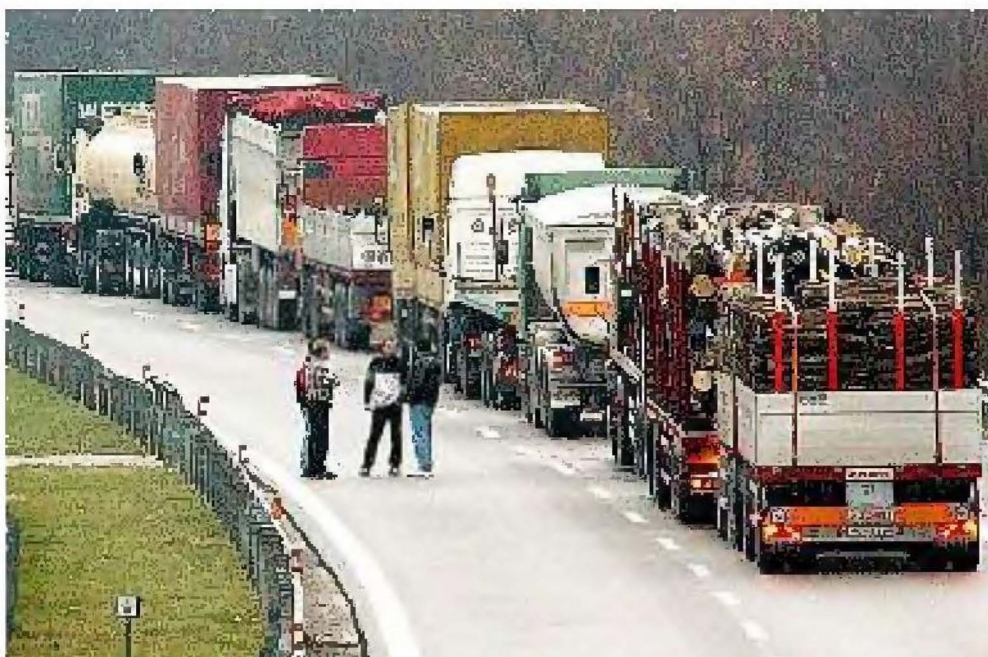
Il rispetto dei tempi di riposo è fondamentale per la salute dei camionisti e per la sicurezza stradale